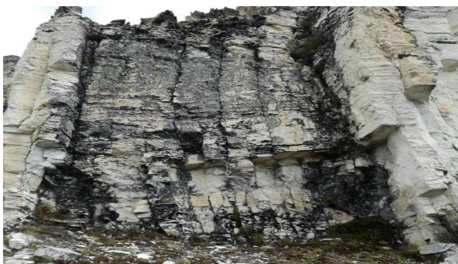
Hallazgo de Litio de alta ley – Falchani (2018)